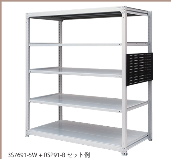
3S7691-5W + RSP91-B セット例